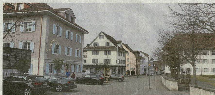
Auf dem Klosterareal könnten neue Begegnungstätten entstehen.