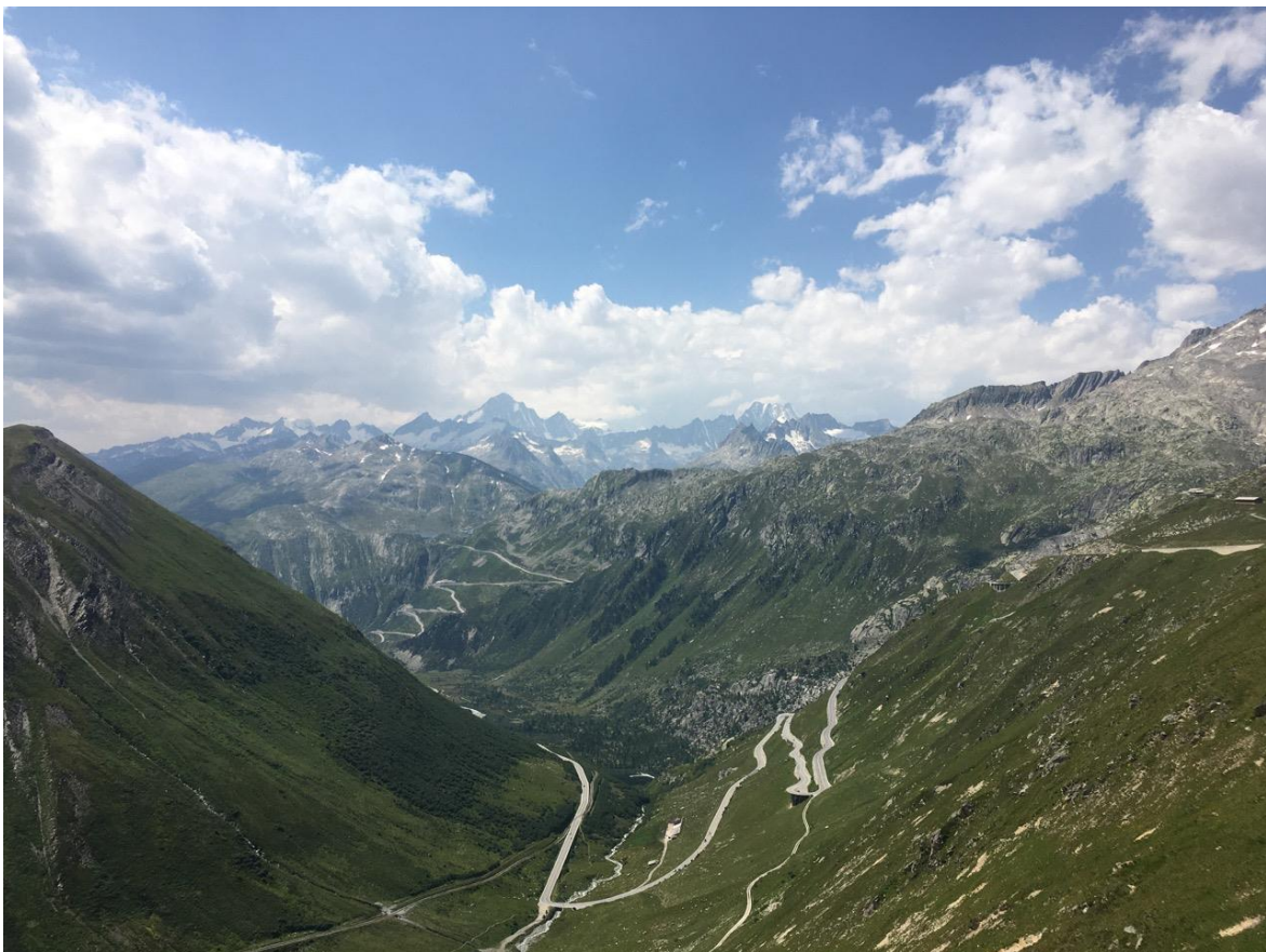
Blick von der Furkapasshöhe hinüber zum Finsteraarhorn über dem Grimselpass