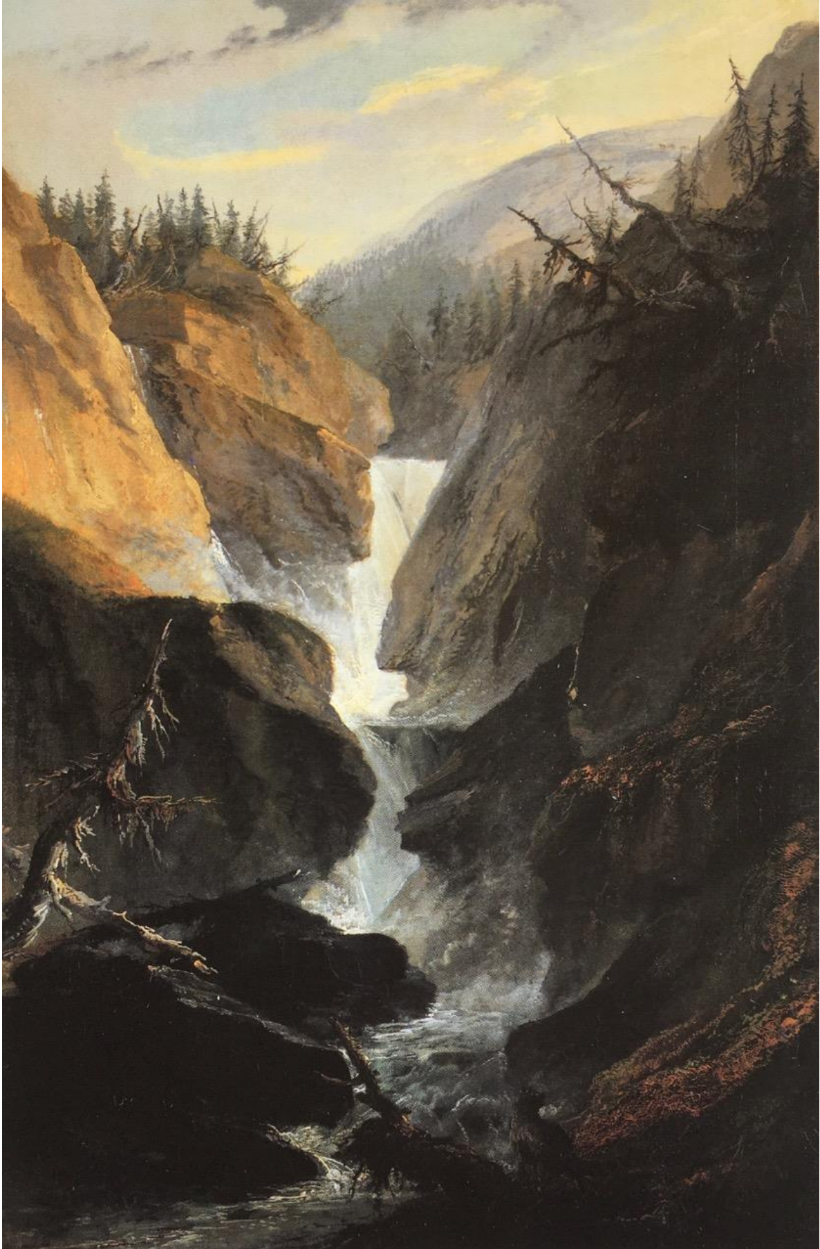
Caspar Wolf: Handeckfall