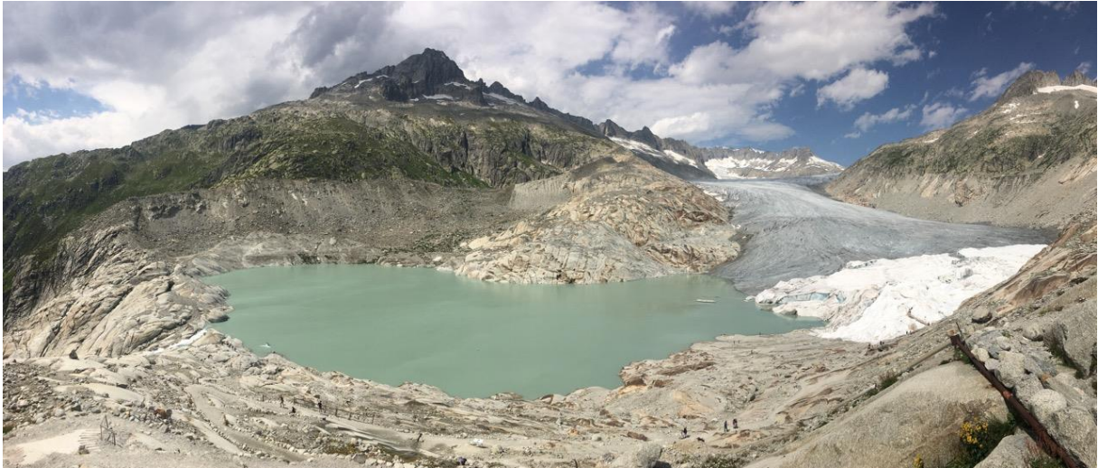
Rhonegletscher am 28. Juli 2020