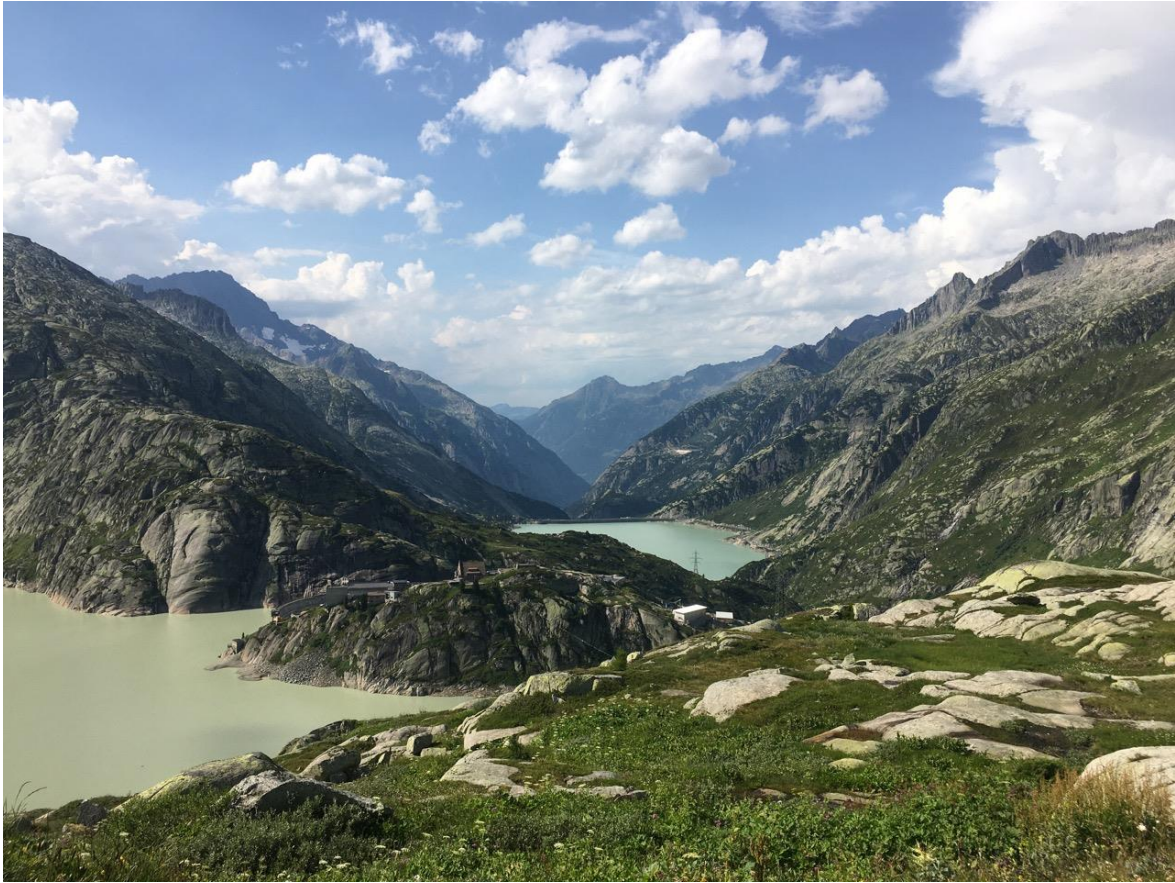
Blick vom Grimselpass Richtung Norden ins Obere Haslital