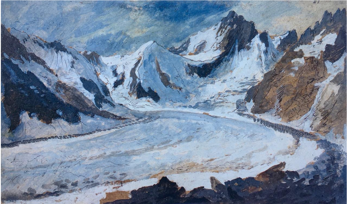
Caspar Wolf: Finsteraargletscher