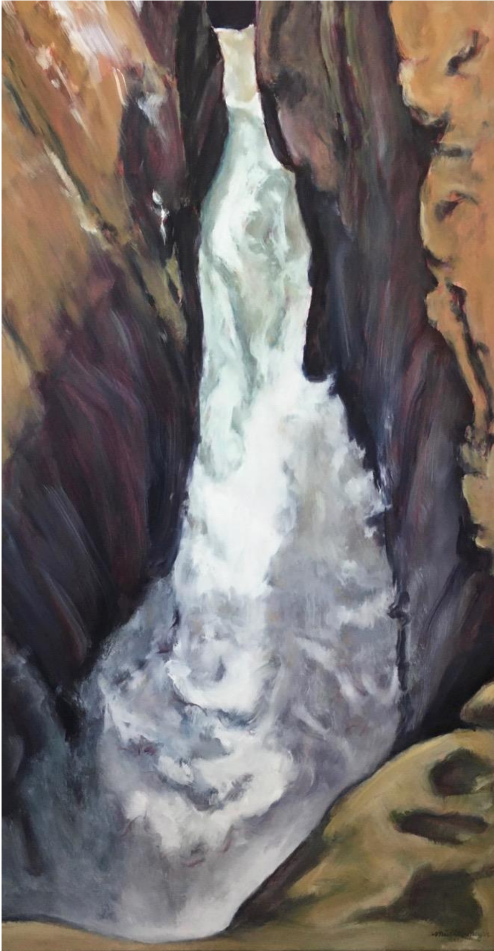
Trümmelbachfall, Öl auf Lw, 200 x 100 cm, 2020