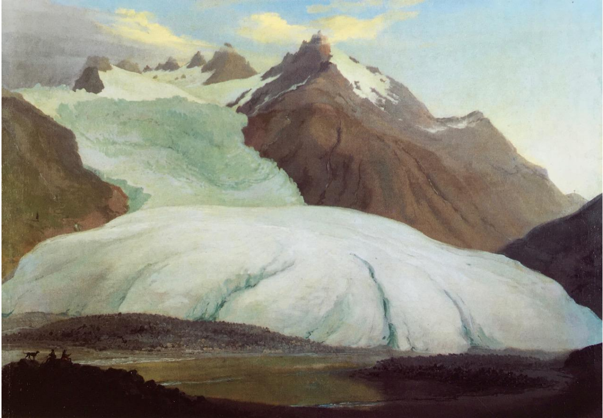
Caspar Wolf: Rhonegletscher