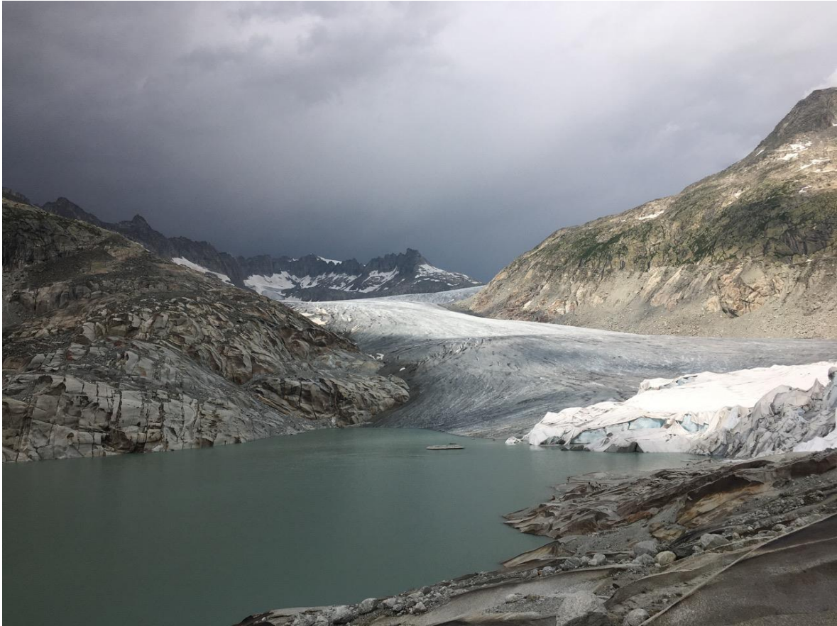
Vor dem Sommergewitter.