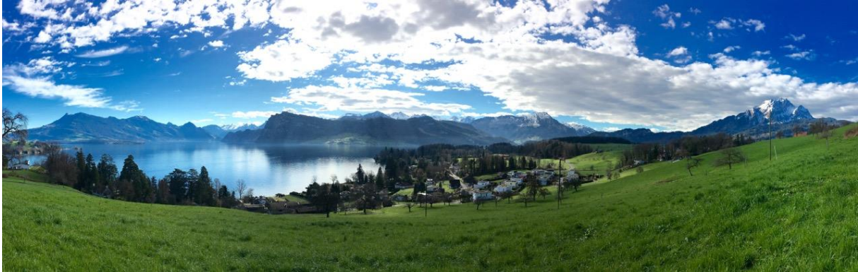
Panorama über der Langensand-Bucht auf der Horwer Halbinsel

Über den Sommer war ich auf der Grand Tour unterwegs, habe viel über Caspar Wolf und seine Zeit gelesen und mir an inspirierenden Orten Gedanken zu möglichen Bildfindungen gemacht, welche ich in einer nächsten Phase in Form von Zeichnungen experimentell angehen werde. Ich schicke Dir hier einige Fotos und Stichworte aus meinem Tagebuch.