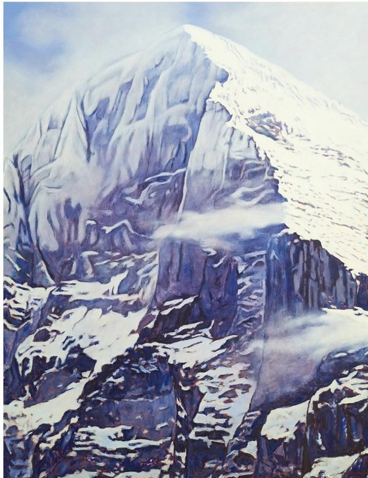
Bruno Müller-Meyer 16.06.20 — 22.08.20

Eigernordwand, Öl auf Leinwand, 200 x 155cm, 2020