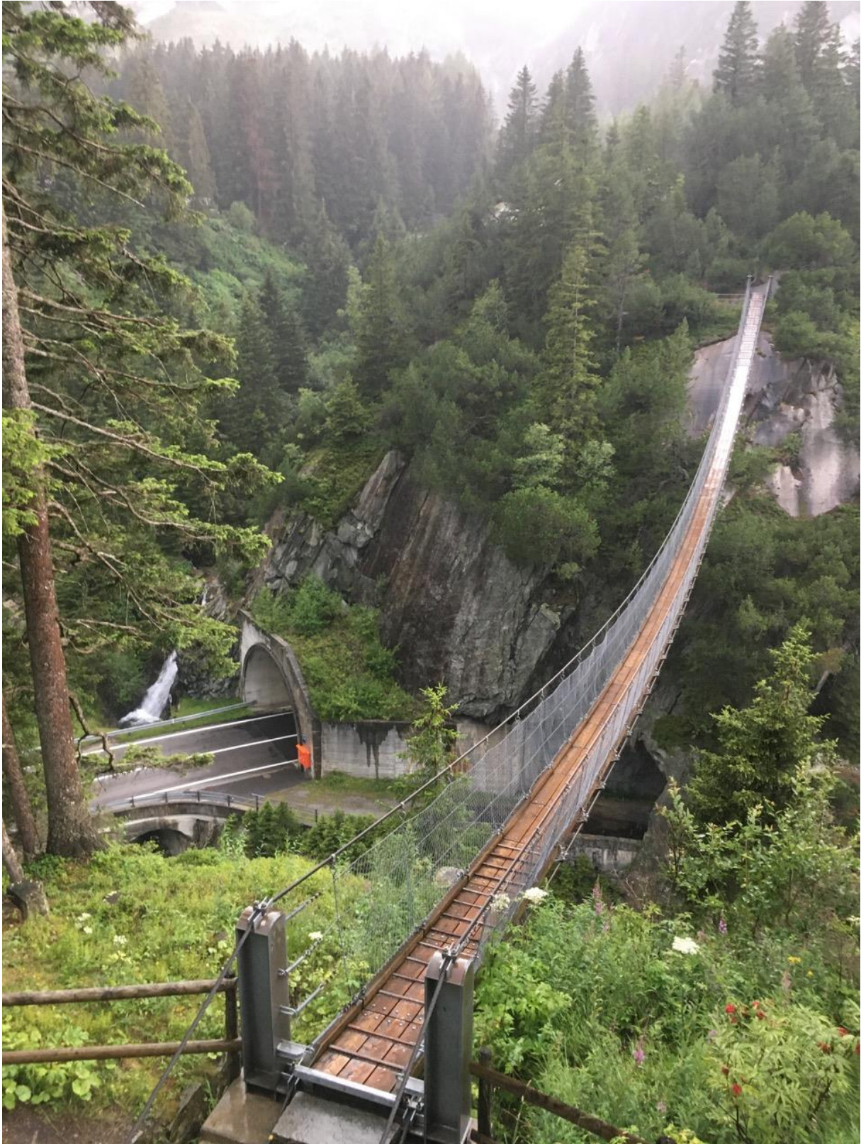
Hängebrücke über dem Handeckfall am 28. Juli 2020