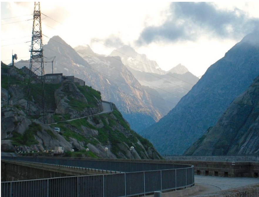
Blick zum Finsteraarhorn von der Grimselstrasse aus