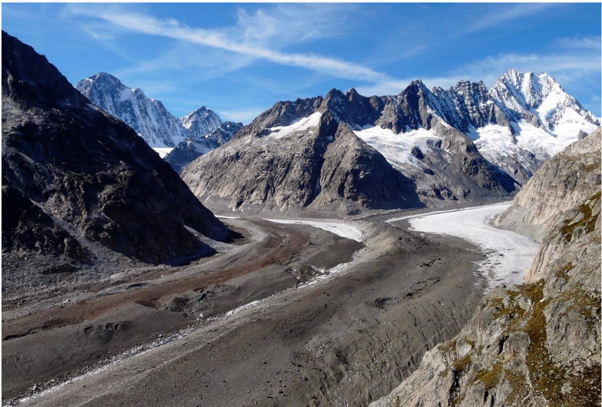
Heutiger Blick auf diese Gletscherregion