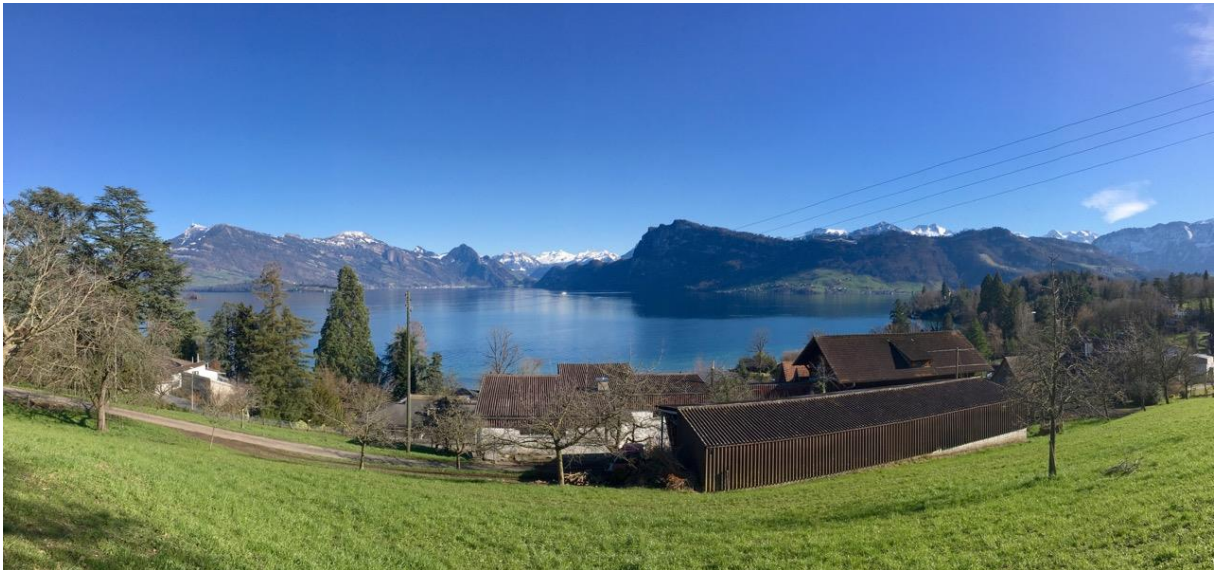
In dem Gebäude in der Mitte befindet sich seit zwanzig Jahren mein Atelier.