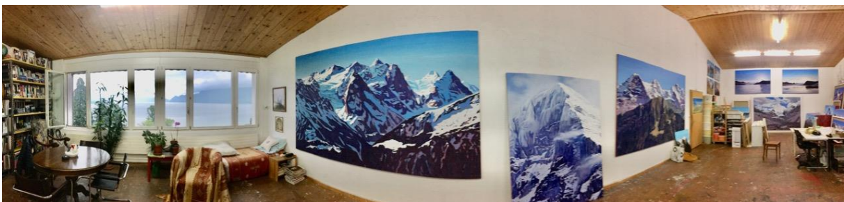
Als die Einladung zur Grand Tour kam, war ich gerade mit Motiven aus dem Berner Oberland beschäftigt.