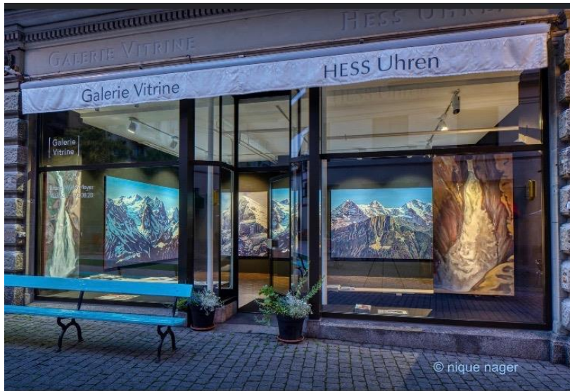
Meine aktuelle Ausstellung in der Galerie Vitrine in Luzern.

Eigernordwand, Öl auf Leinwand, 200 x 155cm, 2020