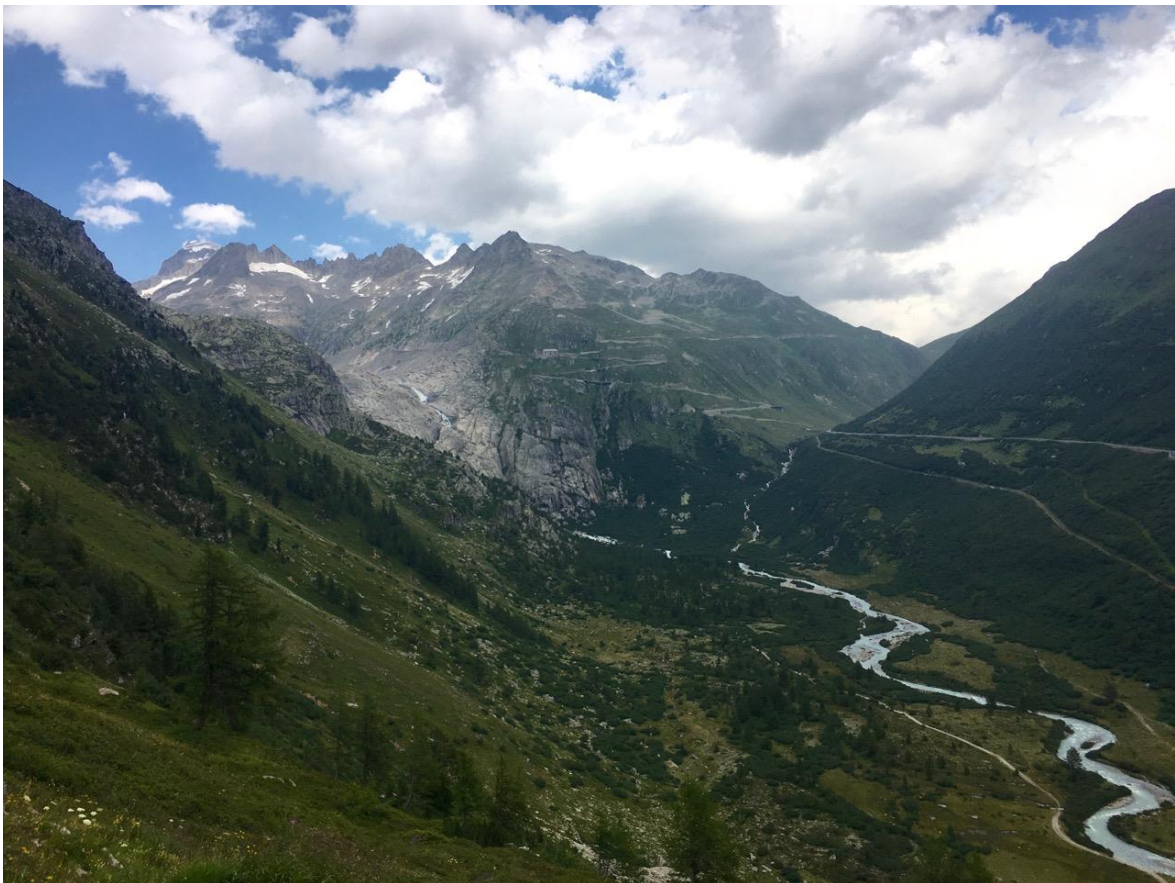
Blick hinüber zur Furka-Region